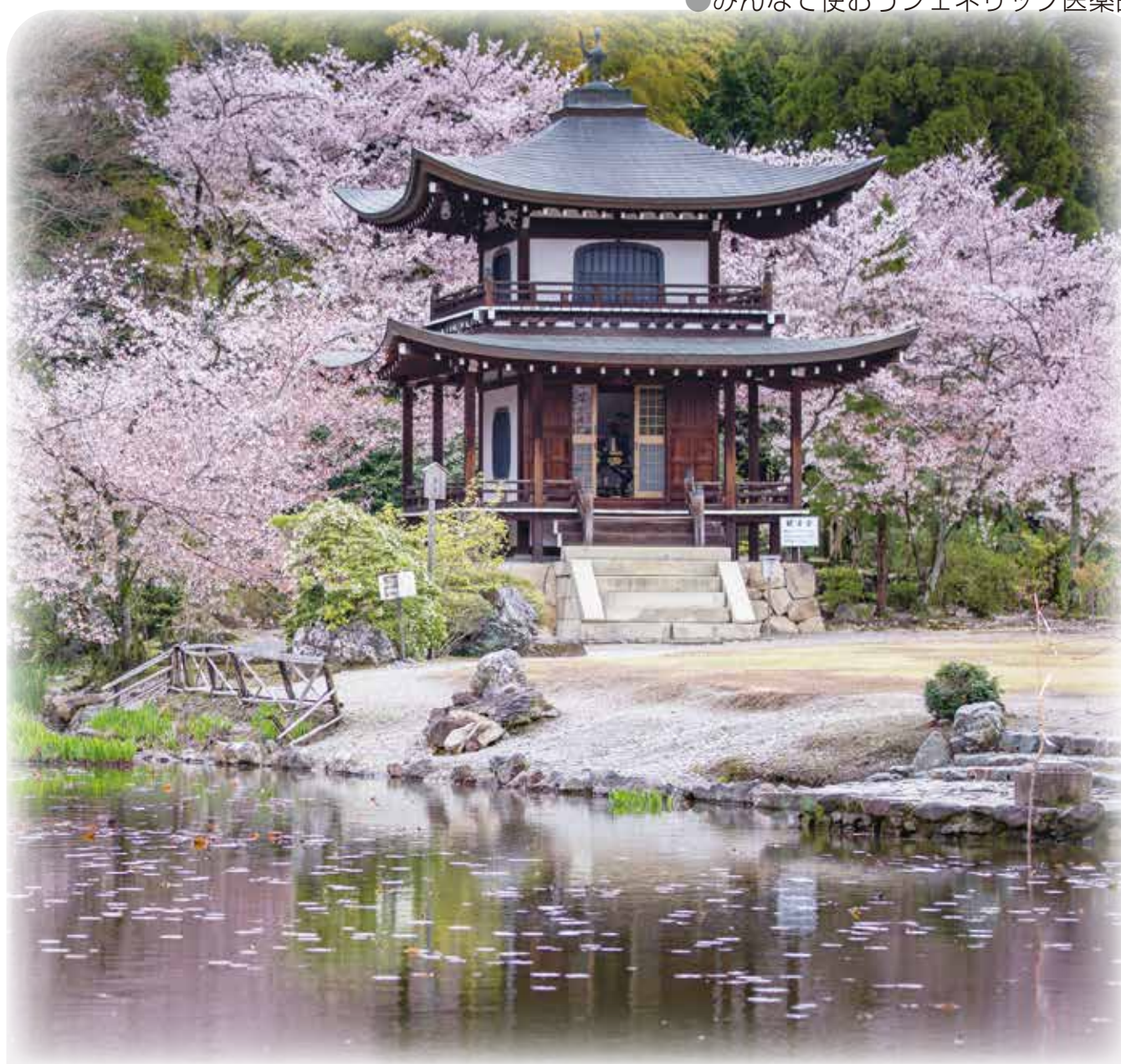
表紙写真 京都（勧修寺）