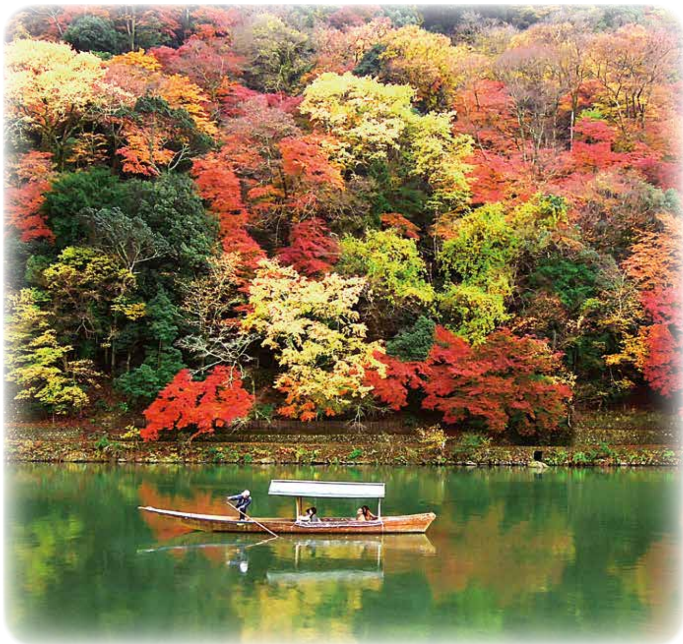
〈京都府 嵐山の紅葉〉