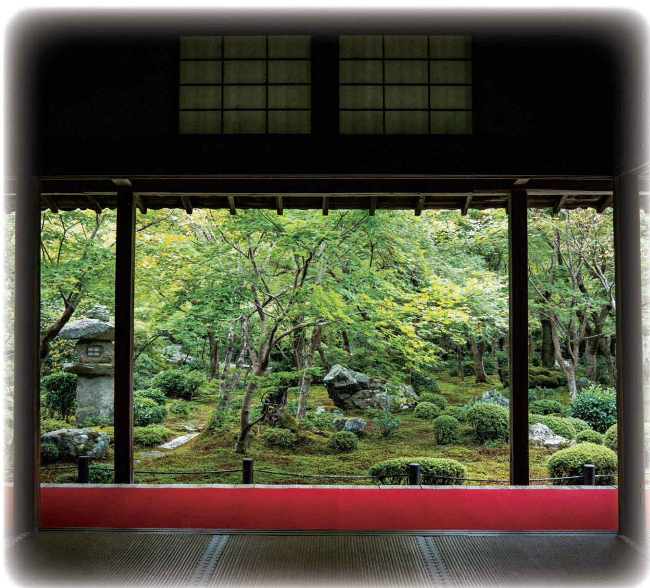
〈京都府 圓光寺の庭園〉